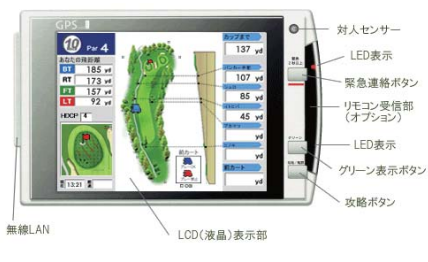
GPS GOLF NAVI DH-300