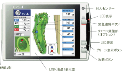
GPS GOLF NAVI DH-300

お客様と無線でやり取りして、行動する までに10~15分くらいかかっていたでし ょうか。今は、「はい、分かりました。すぐ に行かせて届けます」と、2分もあれば すぐに行動に移せますから、見つけるのも 早いんですよ。