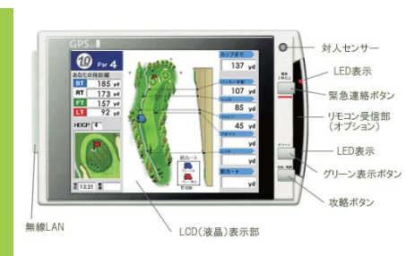
GPS GOLF NAVI DH-300

たものは宣伝ですからあまり真剣に画面を見ていただくということにならないわけです。各種コンペやイベントのご案内を、プレーを楽しむお客様に対して自然な形でPRできる仕掛けと一緒に考えていけるといいですね。